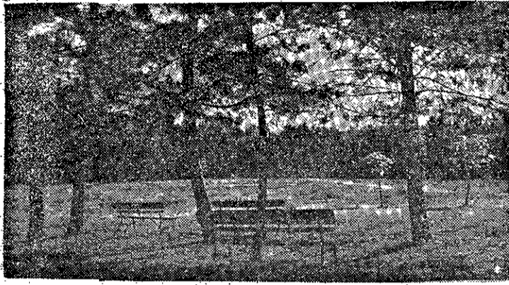
Ένα κρημα το μέγιστο πάγκου των Κομηνηών

ΑΠΟ ΤΑ ΑΡΧΑΙΟΤΕΡΑ ΚΑΙ ΤΑ ΠΛΕΟΝ ΔΡΑΣΤΗΡΙΑ ΠΟΝΤΙΑΚΑ ΣΩΜΑΤΕΙΑ ΒΟΡ. ΕΛΛΑΔΟΣ